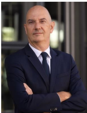
Roland Lescure, ministre délégué auprès du ministre de l'Économie, des Finances et de la Souveraineté industrielle et numérique, chargé de l'Industrie

L'industrie française est dynamique, ambitieuse et en pleine croissance. C'est un ensemble de secteurs d'avenir, qui offrent une grande variété de métiers allant des laboratoires à la production, pour tous les niveaux de qualification, qui rémunèrent bien, accordent une place centrale aux conditions de travail et sont présents sur tous nos territoires, à travers plus de 3 millions de salariés et près de 260 000 entreprises.