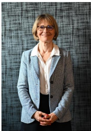
Véronique Louwagie, ministre déléguée chargée du Commerce, de l'Artisanat, des Petites et moyennes entreprises et de l'Économie sociale et solidaire

« Le label Entreprise du Patrimoine Vivant (EPV) est bien plus qu'une simple distinction : c'est un gage de qualité et de savoir-faire à la française.