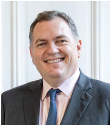
Philippe TABAROT Ministre chargé des Transports

La France est aujourd'hui un leader mondial de l'industrie aéronautique, une filière d'excellence dont nous sommes fiers. Demain, la France sera un leader mondial du transport aérien décarboné. Plusieurs raffineries françaises produisent déjà des biocarburants. Nous allons augmenter dans les prochaines années ces volumes produits. En 2030, en France, des projets industriels pionniers produiront également des carburants d'aviation durable de synthèse grâce à l'électricité décarbonée abondante et au CO 2 biogénique disponibles sur notre territoire. La signature aujourd'hui au salon du Bourget du contrat de filière illustre nos ambitions : faire émerger une nouvelle filière industrielle innovante qui permettra de décarboner le transport aérien français.