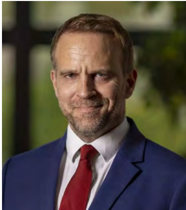
Marc FERRACCI Ministre chargé de l'Industrie et de l'Énergie

Le développement des carburants d'aviation durables représente un levier stratégique pour notre souveraineté industrielle et énergétique. En soutenant cette nouvelle filière, nous faisons le choix d'une industrie française innovante, compétitive et créatrice d'emplois sur nos territoires. Cette ambition s'inscrit pleinement dans notre stratégie de réindustrialisation verte : investir dans les technologies bas-carbone, mobiliser notre écosystème économique, renforcer notre autonomie face aux chaînes de valeur mondiales. Le contrat signé aujourd'hui incarne cette dynamique collective. Il ouvre la voie à une industrie aéronautique décarbonée et souveraine, à la hauteur des défis environnementaux comme économiques du XXI e siècle.