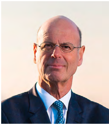
Éric Lombard Ministre de l'Économie, des Finances et de la Souveraineté industrielle et numérique

Le développement des carburants d'aviation durables représente un levier stratégique pour notre souveraineté industrielle et énergétique. En soutenant cette nouvelle filière, nous faisons le choix d'une industrie française innovante, compétitive et créatrice d'emplois sur nos territoires. Cette ambition s'inscrit pleinement dans notre stratégie de réindustrialisation verte : investir dans les technologies bas-carbone, mobiliser notre écosystème économique, renforcer notre autonomie face aux chaînes de valeur mondiales. Le contrat signé aujourd'hui incarne cette dynamique collective. Il ouvre la voie à une industrie aéronautique décarbonée et souveraine, à la hauteur des défis environnementaux comme économiques du XXI e siècle.