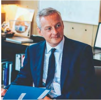
Bruno Le Maire Ministre de l'Économie, des Finances et de la Relance.

À la fois essentielle à la souveraineté des Etats, à la pérennité du développement des entreprises et à la sécurité des citoyens, la cybersécurité est un enjeu majeur du XXI e siècle.