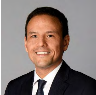
Cédric O Secrétaire d'Etat chargé de la Transition numérique et des Communications électroniques.

A la fois moyen de communication, outil de travail et demain pilote de nos véhicules autonomes, le numérique imprègne chaque jour un peu plus notre vie quotidienne. Les outils numériques apportent avant tout un bénéfice à qui sait les maîtriser, mais leur développement nous a aussi rendus plus vulnérables face aux attaques cyber. Il est donc du rôle de l'Etat d'accompagner la prise de conscience des utilisateurs du numérique face à ce risque, les aider à s'en prémunir, et soutenir le développement d'une filière française de la cybersécurité.