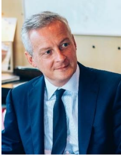
Bruno Le Maire