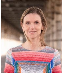
Agnès Pannier-Runacher, secrétaire d'État auprès du ministre de l'Économie et des Finances

Une administration accessible, dont l'organisation est plus claire et avec des démarches plus rapides, c'est ce à quoi prétendent les Français. Il en va non seulement de leurs droits d'accès aux services publics mais aussi de la compétitivité de notre économie.