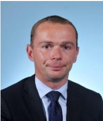
Olivier Dussopt, secrétaire d'État auprès du ministre de l'Action et des Comptes publics

Avec la loi d'accélération et de simplification de l'action publique, ou loi ASAP, nous allons initier une nouvelle étape dans la transformation de l'action publique. Nous prenons trois engagements forts.