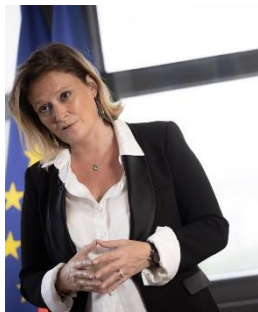
Olivia Grégoire Secrétaire d'État auprès du ministre de l'Économie, des Finances et de la Relance, chargée de l'Économie sociale, solidaire et responsable

« Ce guide pratique du mécénat de compétences est un outil à votre disposition, salariés, dirigeants, entrepreneurs, acteurs de l'intérêt général, pour vous saisir plus facilement de ce dispositif gagnant-gagnant.