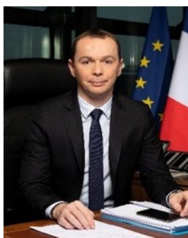
Olivier Dussopt Ministre délégué chargé des Comptes publics

Une réponse efficace ne peut être apportée que si la répression pénale relaie efficacement le contrôle de l'administration. L'action pénale contre les fraudeurs est le prolongement nécessaire de la vigilance des pouvoirs publics. Quelle que soit la sévérité de la peine, la juste sanction prononcée par le juge sert d'exemple et rappelle à tous que le respect de la loi est la première des exigences du vivre-ensemble. Cette conviction est celle qui a notamment inspiré la loi de lutte contre la fraude adoptée par le Parlement en 2018, dont il est déjà possible de dresser un premier bilan satisfaisant en termes de nombre d'affaires transmis aux parquets.