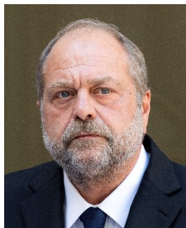
Éric Dupond-Moretti Garde des Sceaux, ministre de la Justice

Lutter ensemble contre les fraudes nécessite un travail interministériel constant et permanent. Le ministère de la Justice et le ministère de l'économie, des finances et de la relance travaillent depuis plusieurs années étroitement pour lutter contre les différentes formes de fraudes économiques.