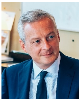
Bruno Le Maire Ministre de l'Économie, des Finances et de la Relance

Notre pays a plus que jamais besoin de justice face à l'impôt et d'un cadre économique sain, dans lequel la concurrence n'est pas faussée ni les consommateurs trompés. La plus grande sévérité dans la lutte contre la fraude sous toutes ses formes est l'une des conditions pour qu'existe une véritable relation de confiance entre l'administration et les citoyens.