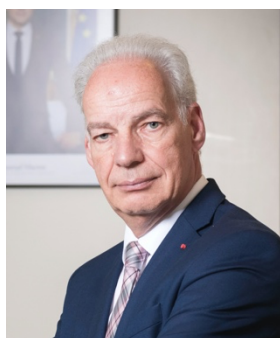
Alain Griset, Ministre délégué auprès du ministre de l'Économie, des Finances et de la Relance, chargé des Petites et Moyennes Entreprises

Ces assises sont destinées à préparer l'avenir du commerce en France, et de définir un nouvel équilibre commercial sur notre territoire.