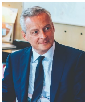
Bruno Le Maire, Ministre de l'Économie, des Finances et de la Relance