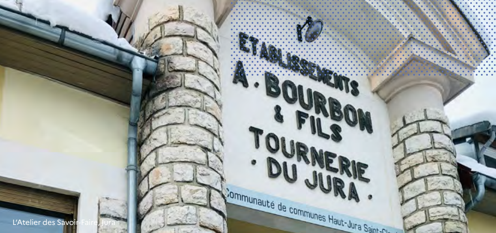
L'Atelier des Savoir-Faire, Jura