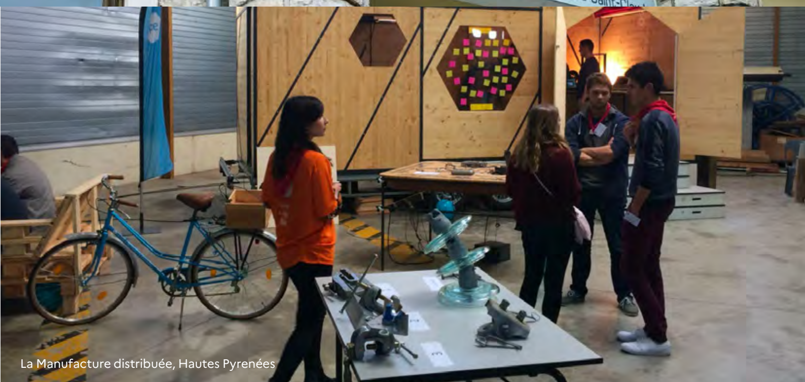
La Manufacture distribuée, Hautes Pyrénées