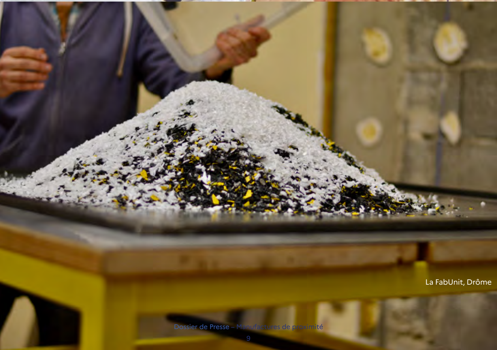
La FabUnit, Drôme