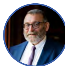
Joël Giraud ministre délégué en charge de la ruralité