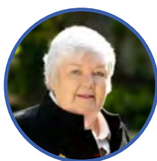
Jacqueline Gourault, ministre de la Cohésion des territoires et des Relations avec les collectivités territoriales

Les vingt premières Manufactures de proximité lauréates contribuent au renforcement de l'activité économique dans nos territoires, souhaité par le gouvernement depuis le début du quinquennat. Action cœur de ville, Petites villes de demain, Territoires d'industrie, puis France Relance – autant de programmes qui répondent à un objectif simple : créer une dynamique économique locale tout en favorisant la promotion des métiers, des compétences et des savoir-faire.