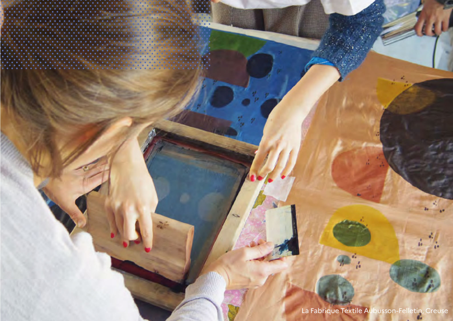
La Fabrique Textile Aubusson-Felletin, Creuse