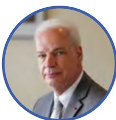
Alain Griset ministre délégué chargé des Petites et Moyennes Entreprises