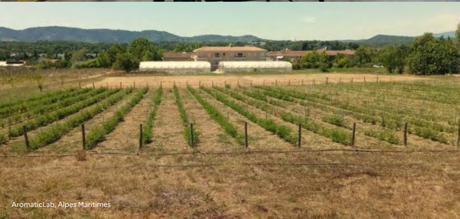
AromaticLab, Alpes Maritimes