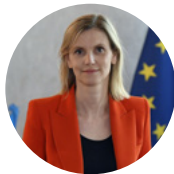
Agnès Pannier-Runacher, Ministre déléguée chargée de l'Industrie