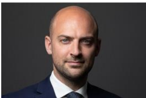
JEAN-NOËL BARROT Ministre délégué chargé de la Transition numérique et des Télécommunications

« Alors que l'enjeu de nourrir sainement et durablement le monde est encore devant nous, le monde agricole fait face à une nécessaire transition.