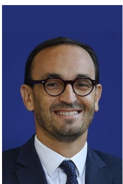
Thomas Cazenave Ministre délégué chargé des Comptes publics

Nous devons embarquer l'ensemble des entreprises dans le processus de transition écologique et énergétique. Pour atteindre les objectifs environnementaux de la France, 4 millions de PME doivent engager leurs transitions. Nous devons les y aider par des règles claires, ainsi que des dispositifs lisibles et adaptés : tout Bercy est mobilisé dans cet objectif.