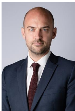
Jean-Noël Barrot Ministre délégué chargé du Numérique

Le numérique sera essentiel pour optimiser l'utilisation des ressources, réduire notre empreinte carbone et développer des solutions innovantes pour les défis environnementaux auxquels nous sommes confrontés. Nous avons un rôle crucial à jouer dans la transition écologique. Bercy a pleinement pris sa part en contribuant à faire adopter une feuille de route ambitieuse de décarbonation du secteur, je veillerai à sa mise en œuvre. »