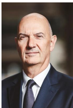
Roland Lescure Ministre délégué chargé de l'Industrie

L'exemplarité. Notre ministère sera irréprochable dans la transformation de son organisation et dans la baisse de son empreinte écologique. Ce dossier de presse vise à illustrer avec quelques exemples concrets l'implication de Bercy pour la transition écologique.