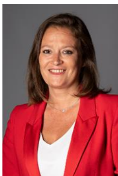
Olivia Grégoire Ministre déléguée chargée des Petites et moyennes entreprises, du Commerce, de l'Artisanat et du Tourisme

Le numérique sera essentiel pour optimiser l'utilisation des ressources, réduire notre empreinte carbone et développer des solutions innovantes pour les défis environnementaux auxquels nous sommes confrontés. Nous avons un rôle crucial à jouer dans la transition écologique. Bercy a pleinement pris sa part en contribuant à faire adopter une feuille de route ambitieuse de décarbonation du secteur, je veillerai à sa mise en œuvre. »