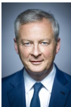
Bruno Le Maire Ministre de l'Économie, des Finances et de la Souveraineté industrielle et numérique

La transition écologique n'est pas un choix politique, c'est une obligation humaine pour garder notre terre habitable.