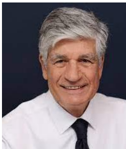
Maurice Lévy Ambassadeur « Je choisis la French Tech »

Alors, administrations et entreprises, y compris les start-ups, nous vous appelons à davantage choisir la French Tech ! »