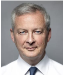
Bruno Le Maire Ministre de l'Économie, des Finances et de la Souveraineté industrielle et numérique

« Nous avons l'immense chance, en France, de bénéficier d'un écosystème de startups innovantes et dynamiques, dans la deeptech, l'industrie verte, les services.