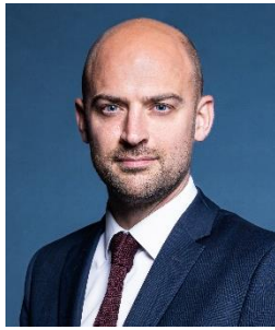
Jean-Noël Barrot Ministre délégué chargé de la Transition numérique et des Télécommunications

« La French Tech fête ses 10 ans cette année. Nous pouvons nous féliciter du chemin parcouru depuis 2013 où tout un écosystème restait encore à bâtir. Sous l'impulsion du Président de la République et grâce au travail et à la passion des entrepreneurs français, la French Tech rayonne dans notre pays et à l'international. Durant ces dix années, nous sommes parvenus à faire de la France un des pays les plus attractifs au monde pour les start-ups qui veulent se lancer, partir à la conquête des marchés internationaux et créer un avenir qui ait du sens.